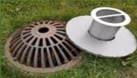
Granulatsil for kummer