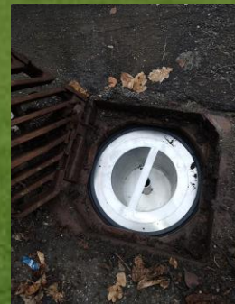
Granulatsil for kummer